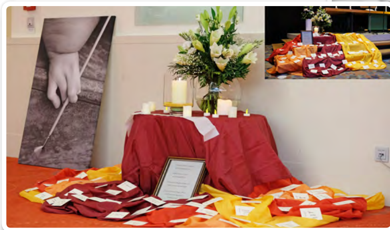
^ Gedenken an die Verstorbenen